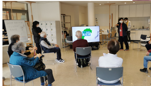
モニターを用いた脳のトレーニング