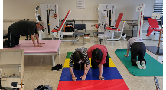
マットを使った体操